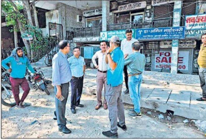
गांधी आश्रम चौराहे से तेजगढ़ी तक ग्रीन सड़क निर्माण की कवायद तेज हो गई है।

मंगलवार को नगर निगम सभागार में मुख्यमंत्री ग्रिड स्कीम को लेकर शासन के अधिकारियों और 11 विभागों के अधिकारियों, इंजीनियरों की बैठक हुई। यूरिडा के प्रतिनिधि एडवर्ट जॉनी ने बताया कि मेरठ समेत प्रदेश के सभी नगर निगमों के लिए ग्रीन सड़क की योजना लाई गई है। मेरठ में