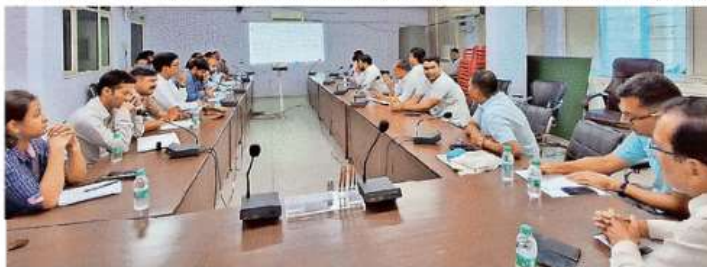
नगर निगम सभागार में मुख्यांश ग्रिड योजना की बैठक करते शासन और नगर निगम के अधिकारी

10 साल तक कोई विभाग नहीं खोद सकेगा सड़क, निर्माण से पहले पूरे करने होंगे सारे काम