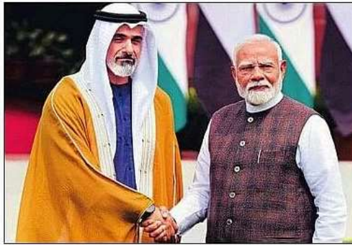
अबूधाबी के क्राउन प्रिंस के साथ प्रधानमंत्री मोदी।

फूड पार्क होगा स्थापित... चोथा समझौता ऊर्जा भारत और एडीएनओसी के बीच अबूधाबी ऑनशोर ब्लॉक-1 के लिए उत्पादन रियायत का हुआ। भारत में फूड पार्क स्थापित करने के लिए गुजरात सरकार और अबूधाबी डेवलपमेंट होल्डिंग कंपनी पीजेएससी के बीच एक अलग समझौता हुआ।