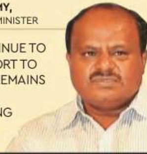
NITIN GADKARI, ROAD TRANSPORT & HIGHWAYS MINISTER

WE WILL CONTINUE TO PROVIDE SUPPORT TO ENSURE INDIA REMAINS A LEADER IN MANUFACTURING & INNOVATION