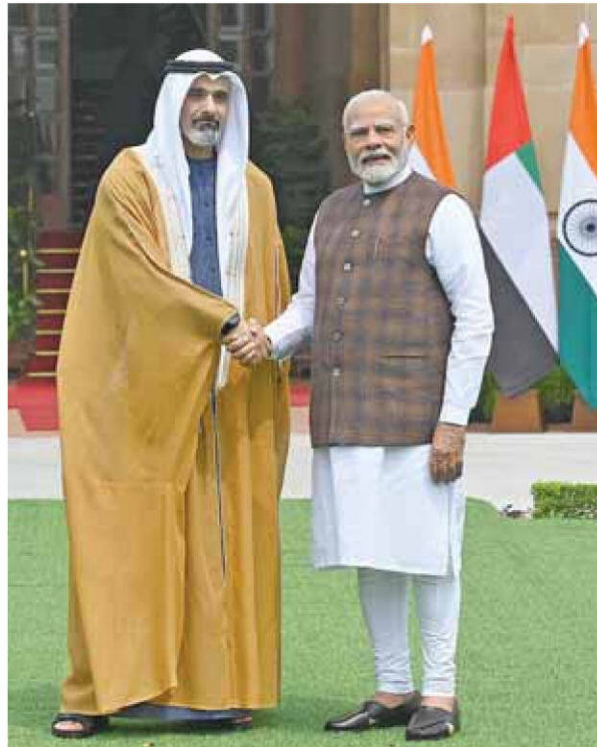
Prime Minister Narendra Modi meets Abu Dhabi's Crown Prince Sheikh Khaled bin Mohamed bin Zayed Al Nahyan at the Hyderabad House, in New Delhi, Monday

An Agreement for long-term LNG supply between Abu Dhabi National Oil Company (ADNOC) and Indian Oil Corporation Ltd and another between ADNOC and India Strategic Petroleum Reserve Ltd (ISPRL) are among the