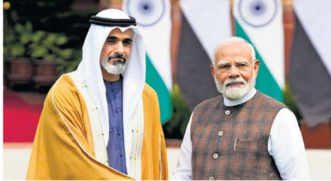
PM Narendra Modi with Abu Dhabi Crown Prince Sheikh Khaled bin Mohamed bin Zayed Al Nahyan in New Delhi