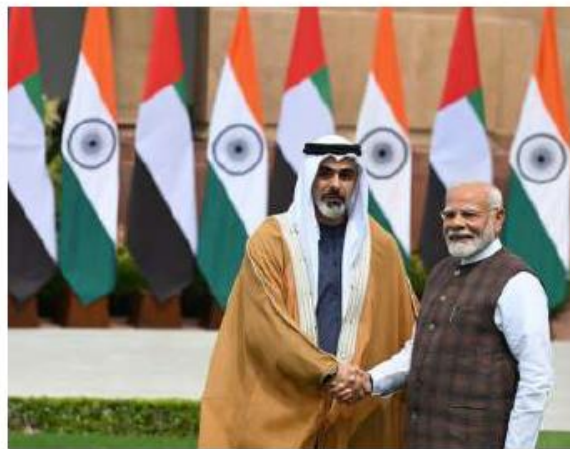
Prime Minister Narendra Modi with Crown Prince Sheikh Khalid bin Mohamed bin Zayed Al Nahyan on Monday.

Diplomatic sources pointed out that nothing like the agreement between the NPCIL and the ENEC had been signed before. The deal is part of the UAE's policy of expanding