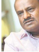
H. D. Kumaraswamy, Union minister, heavy industries.

About 1.6 million EVs were sold in India in FY24, of which 90,432—or 5.4%—were four-wheelers, according to the