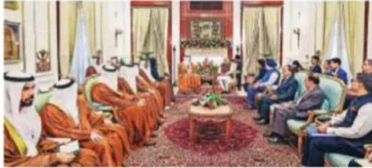
PM Narendra Modi with Abu Dhabi Crown Prince Sheikh Khaled bin Mohamed bin Zayed Al Nahyan at a meeting.

The fourth pact is a production concession agreement for Abu Dhabi Onshore Block 1 be-