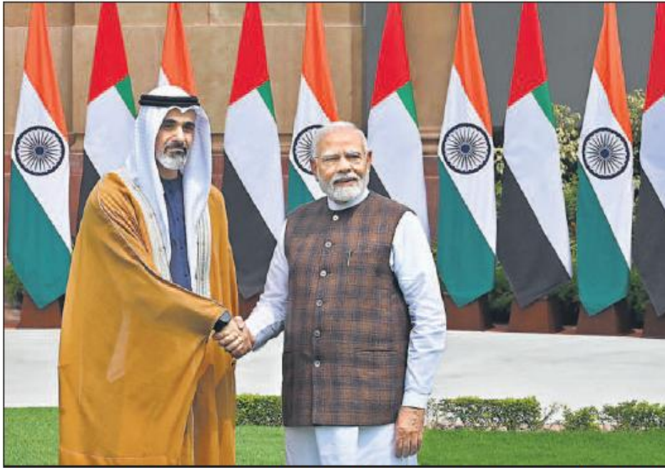
Prime Minister Narendra Modi meets Abu Dhabi Crown Prince Sheikh Khaled bin Mohamed bin Zayed Al Nahyan at Hyderabad House in Delhi on Monday.