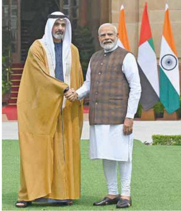
प्रधानमंत्री नरेन्द्र मोदी ने सोमवार को नई दिल्ली में हैदराबाद हाउस में अबू धाबी के क्राउन प्रिंस शेख खालिद बिन मोहम्मद बिन जायद अल नाहयान से भेंट की।

विदेश मंत्रालय के अनुसार, अमीरात परमाणु ऊर्जा कंपनी (ईएनईसी) और न्यूक्लियर पावर कॉर्पोरेशन ऑफ इंडिया लिमिटेड (एनपीसीआईएल) ने भी बाराकह परमाणु ऊर्जा संयंत्र के संचालन और रखरखाव के लिए एक समझौता ज्ञापन पर हस्ताक्षर किए। चौथा समझौता अबू धाबी तटवर्ती ब्लॉक-वन के लिए ऊर्जा भारत और एडीएनओसी के बीच उत्पादन रियायत समझौता है। भारत में फूड पार्क स्थापित करने के लिए गुजरात सरकार और अबू धाबी डेवलपमेंट होल्डिंग कंपनी पीजेएससी के बीच एक अलग समझौता किया गया।