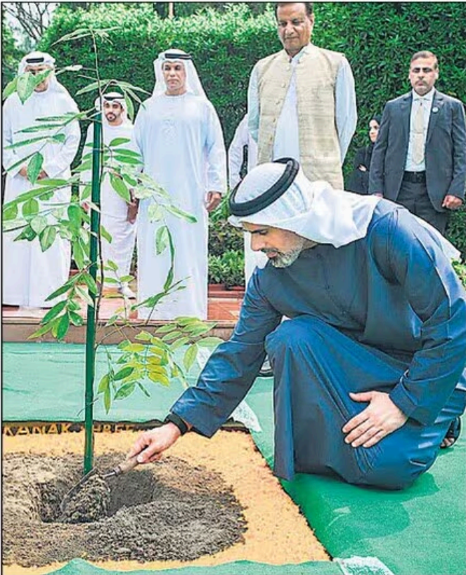
नई दिल्ली में सोमवार को अबू धाबी के युवराज शेख खालिद बिन मोहम्मद बिन जायद अल नाहयान ने राजघाट पर एक पोधा लगाया।

शीर्ष चार निवेशकों में यूएई : अगस्त, 2015 में मोदी की यूएई यात्रा के बाद दोनों देशों के बीच द्विपक्षीय संबंधों को एक व्यापक रणनीतिक साझेदारी तक बढ़ाया गया था। 2022-23 में प्रत्यक्ष विदेशी निवेश के मामले में भी यूएई, भारत में शीर्ष चार निवेशकों में शामिल है।