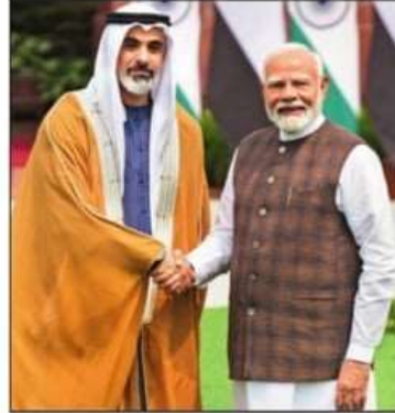
PM Modi with Crown Prince of Abu Dhabi Sheikh Khaled bin Mohamed bin Zayed Al Nahyan

This is the first visit by the Crown Prince, the son of UAE President Mohamed bin Zayed Al Nahyan who is known to share a close rapport with Modi, to India in his official capacity. A list of documents signed said the MoU for nuclear cooperation is in the field of Barakah nuclear power plant operations and maintenance between Emirates Nucle-