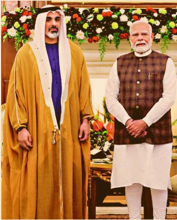
प्रधानमंत्री नरेंद्र मोदी और अबू धाबी के युवराज