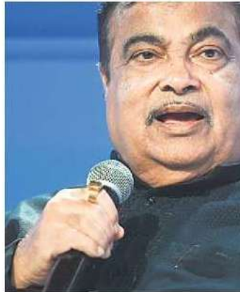
Nitin Gadkari, Union minister of road transport and highways.

Automakers not serious about EVs will be forced to make the shift due to competi-