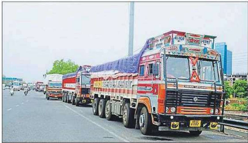
Heavy duty vehicles account for a majority of energy-related carbon dioxide emissions by India's transport sector.

While some cars and buses in India already use compressed natural gas, the government says LNG, which gives better