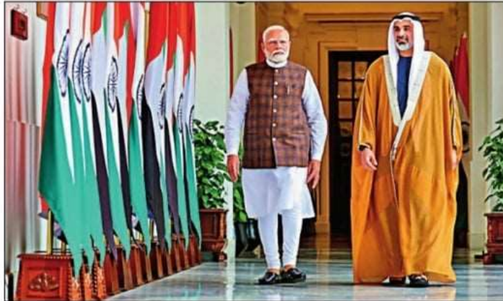
PM Modi with Abu Dhabi's Crown Prince Sheikh Khaled bin Mohamed bin Zayed Al Nahyan at Hyderabad House in New Delhi on Monday

Another MoU between Urja Bharat and ADNOC, the first for any Indian company operating in the UAE, will allow Urja Bharat to