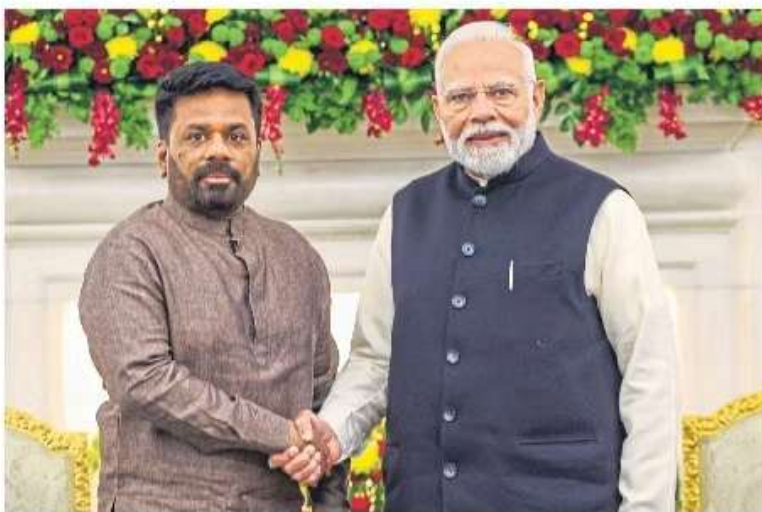
Prime Minister Narendra Modi with Sri Lankan President Anura Kumara Dissanayake during a meeting in New Delhi on Monday.

Both sides also discussed a plan to connect power grids and lay a multi-product petroleum pipeline between the two countries, a joint statement from India's external affairs