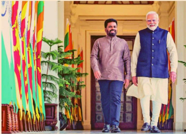
PM Narendra Modi (right) with Sri Lankan President Anura Kumara Dissanayake at the Hyderabad House in New Delhi on Monday

ment of a pipeline between Tamil Nadu and Sri Lanka is expected to ensure an affordable and reliable supply of fuel to the island nation. Processed petroleum exports ($708 million in FY24) made up 17 per cent of India's $4.9 billion exports to the country. Petroleum exports have surged in recent years, rising from $551 million in 2019-20.