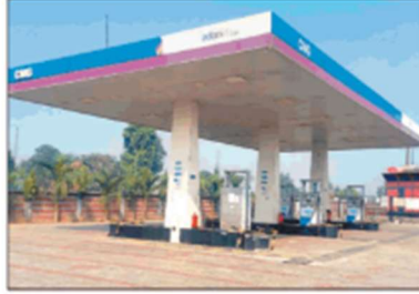
सूने पड़े सीएनजी पम्प।