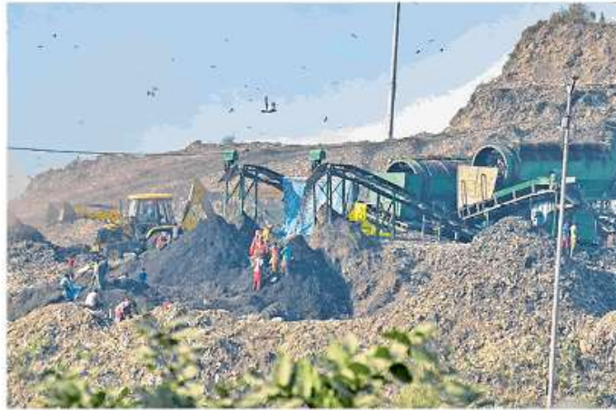
भलखा लैंडफिल साइट पर कूड़ा निस्तारण करती मशीन

जागरण संवाददाता, नई दिल्ली : राजधानी में कचरा प्रबंधन सिरदर्द बना हुआ है। सुप्रीम कोर्ट ने दिल्ली सरकार के हलफनामे पर नाराजगी जाहिर की है। दिल्ली कचरा प्रबंधन के लिए हर काम मशीन से करने की कोशिश में हाथ के इस्तेमाल को भुला दिया गया है। कूड़ा स्थानीय निकायों के लिए मशीन लगाने का एक बड़ा जरिया बन गया है। इसे आगे कर एमसीडी कूड़ा निस्तारण संबंधी अपनी जिम्मेदारी से पल्ला झाड़ लेती है। यही वजह है कि एमसीडी का जोर गीला और सूखा कूड़ा अलग-अलग करने से ज्यादा नए बायो सीएनजी प्लांट से लेकर कूड़े से बिजली बनाने वाले संयंत्र स्थापित करने पर ज्यादा रहता है, जबकि कूड़ा निस्तारण का मूल सूत्र ही गीला व सूखा कूड़ा अलग-अलग करना है। न तो राष्ट्रीय राजधानी