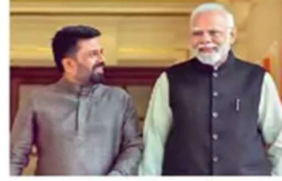
दिल्ली में दिसानायके और मोदी।

पीएम मोदी ने कहा कि भारत ने श्रीलंका को अब तक 42 हजार