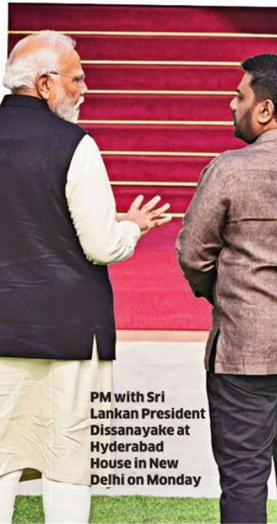
PM with Sri Lankan President Dissanayake at Hyderabad House in New Delhi on Monday

Both countries to focus on investment-oriented growth & physical, digital, energy connectivity