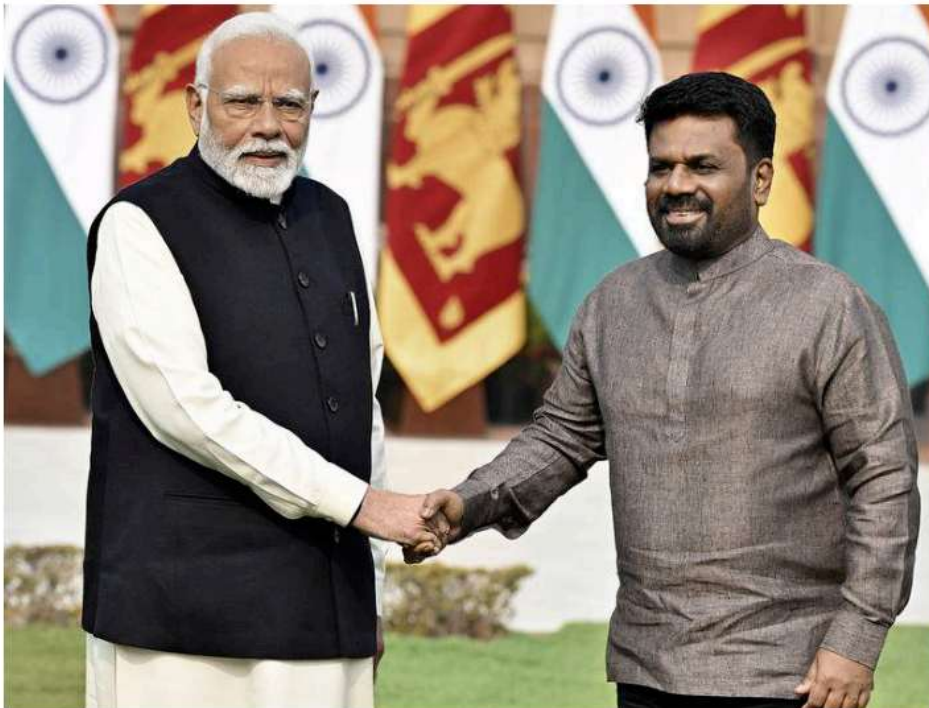
STRONGER TOGETHER. Prime Minister Narendra Modi and Sri Lankan President Anura Kumara Dis-sanayake at Hyderabad House in New Delhi on Monday

"We have adopted a futuristic vision for our partnership. We have laid emphasis on investment-led growth and connectivity in our economic partnership. And have decided that physical, digital and energy connectivity shall be the key pillars of our partnership. We shall work towards establishing electricity grid connectivity and multi-product petroleum pipelines between the two nations," Modi said in his statement to the joint press