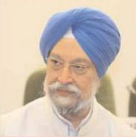
केंद्रीय मंत्री हरदीप सिंह पुरी

दावोस, (भाषा)। यूक्रेन-रूस युद्ध के प्रभावों से निपटने में भारत का उदाहरण देते हुए केंद्रीय मंत्री हरदीप सिंह पुरी ने मंगलवार को कहा कि दुनिया को अपने सामने आने वाली चुनौतियों और संकटों से व्यावहारिक रूप से निपटने की जरूरत है। पुरी यहां विश्व आर्थिक मंच की वार्षिक बैठक में ऊर्जा और प्रतिद्वंद्विता विषय पर एक सत्र को संबोधित कर रहे थे। उन्होंने कहा कि यूक्रेन युद्ध के बाद ऊर्जा संकट का संकेत मिलने के पश्चात भारत ने शुरुआत में ही व्यावहारिक दृष्टिकोण अपनाया और परिणाम सभी के सामने है। पेट्रोलियम और प्राकृतिक गैस मामलों के साथ-साथ आवास और शहरी मामलों के मंत्री पुरी ने कहा कि देखभाल के लिए भारत में एक बड़ी आबादी है और लाखों लोगों को दिन में तीन बार खाना खिलाना सरकार की जिम्मेदारी है। उन्होंने कहा, लेकिन साथ ही हमने अपनी घरेलू मजबूरियों को टिकाऊ भविष्य के प्रति अपनी वैश्विक प्रतिबद्धताओं के आड़े नहीं आने दिया। वहीं, यूरोपीय आयोग के ऊर्जा आयुक्त कादरी सिमसन ने कहा कि वह इस बात से सहमत है कि व्यावहारिकता आवश्यक है और यूरोप भी इसे मानता है। उद्योग और शिक्षा जगत के प्रतिनिधियों सहित पैनल में शामिल वक्ताओं ने ऊर्जा और भू-राजनीति के तेजी से आपस में जुड़ने तथा देशों द्वारा तेल, गैस और स्वच्छ ऊर्जा समाधानों सहित अपनी वैश्विक ऊर्जा आपूर्ति में विविधता लाने के लिए खुले तौर पर प्रतिस्पर्धा करने के बारे में बात की।