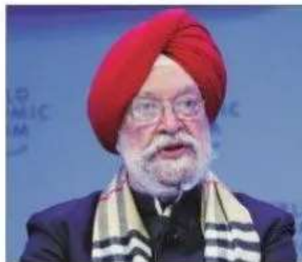
Union minister Hardeep Singh Puri at the WEF annual meet in Davos, Switzerland, on Tuesday.

UNION MINISTER HARDEEP Singh Puri on Tuesday asserted that India can become a $5 trillion economy much before 2028 and said the country's energy transition needs to be done in an orderly manner to safeguard the interests of its large population.