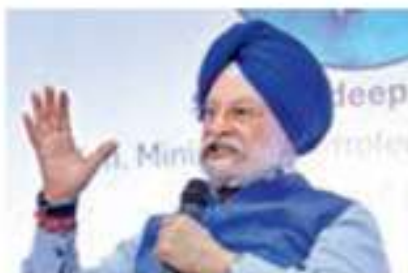
Hardeep Singh Puri