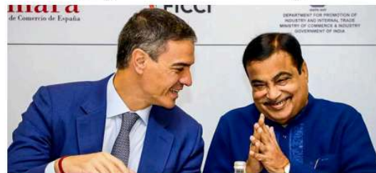
ENABLING NEW COLLABORATIONS. Union Minister Nitin Gadkari with Spain's Prime Minister Pedro Sanchez