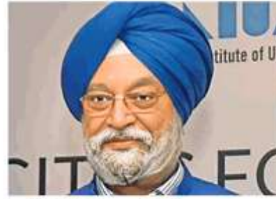
हरदीप पुरी • फाइल फोटो

यहां आयोजित एक रोजगार मेले में एक सवाल का जवाब देते हुए पुरी ने कहा, 'दुनिया में कच्चे तेल की कोई कमी नहीं है। रूस-यूक्रेन युद्ध और पश्चिम एशिया में तनाव से पहले दुनिया में उत्पादित कच्चे तेल की कुल मात्रा 10.5 करोड़ बैरल प्रतिदिन थी। उत्पादक देशों के समूह ओपेक+ ने स्वेच्छा से लगभग 50 लाख बैरल प्रतिदिन की कटौती