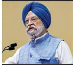
Union Petroleum and Natural Gas Minister Hardeep Singh Puri

"And in all that we are still amongst the lowest prices of