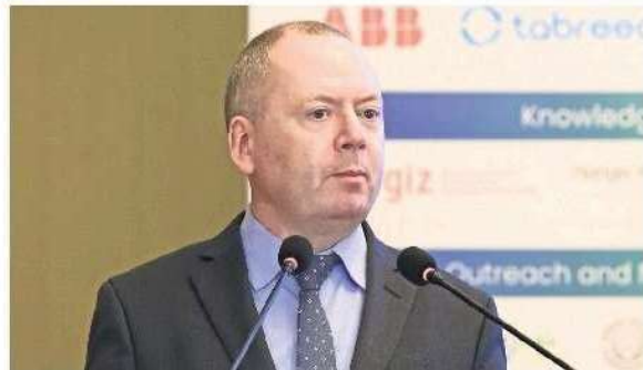
Brian Motherway, head of energy efficiency and inclusive transitions office, International Energy Agency.

Along with energy transition, which has gained momentum due to rapid climate change, energy security is back on policymakers' priority list